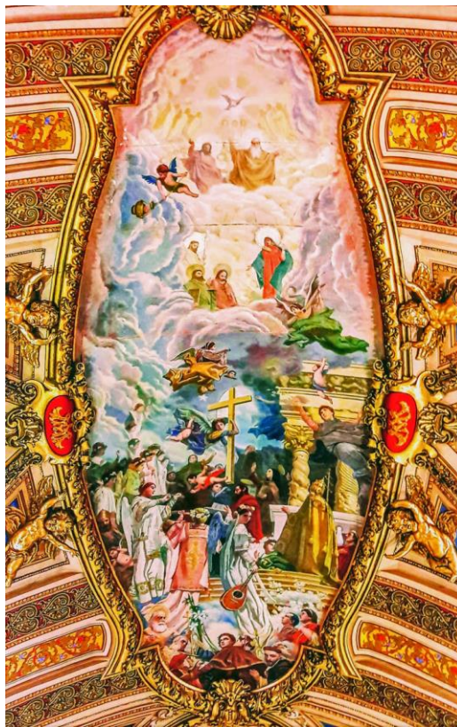
La gloria del cielo 1913-14, Óleo sobre tela en la Catedral