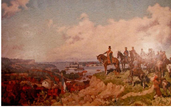
Cruce del Paraná

Está expuesto en el salón Blanco de la Casa de Gobierno de la Provincia de Entre Ríos. Mide 3,20 m de alto por 6,00 m de ancho y constituye la única obra historicista de Caraffa.