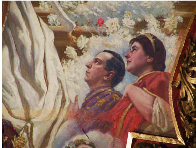
Caraffa en La gloria del cielo

"Esta obra está concebida a través del lenguaje academicista, expresión que se define por su carácter heterodoxo en la conjunción de elementos de diferentes tendencias del pasado, un estilo que asimismo puede precisarse como un "arte término medio" en el cual confluyen exageraciones y mesuras, barroquismos y clasicismos "(Bondone, 2005:7)