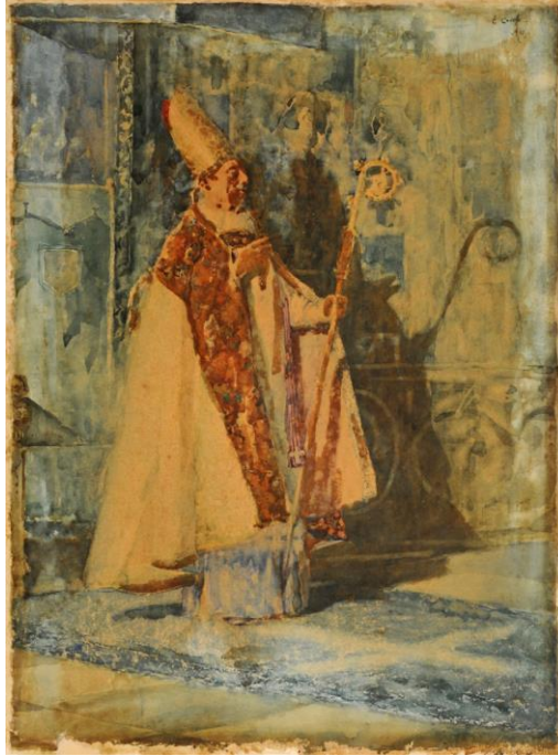
El Obispo, 1888 Acuarela sobre papel 61 x 45

Según José León Pagano, ningún pintor de la generación de Caraffa pintó mejores acuarelas y retratos. Podemos citar algunos como ejemplo: El Obispo , Escena de Teatro y Dama del siglo XV . Fue en Roma donde pintó acuarelas que luego expuso en Madrid en la Sociedad de Acuarelistas.