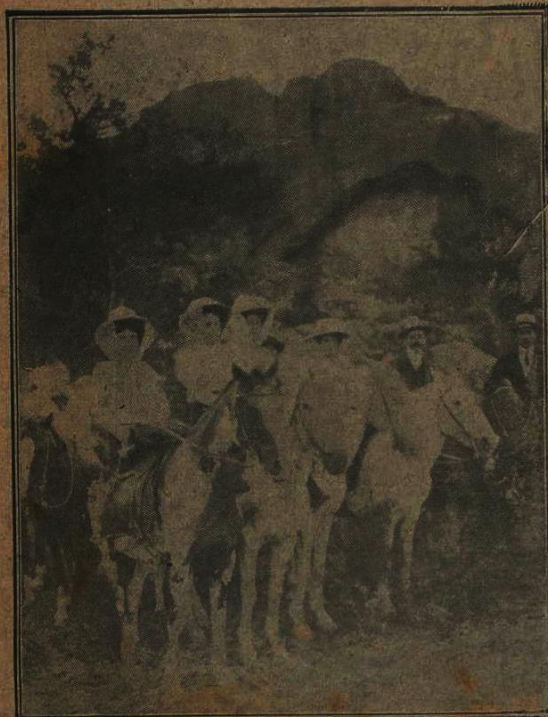
Un grupo encantador. — Señoritas que asistieron a la excursión de Monte del Zapato

En los días 29 y 30 del pasado mes de enero, se celebraron en Capilla del Monte (provincia de Córdoba) grandes fiestas, con motivo de la colocación de la piedra fundamental del nuevo templo.