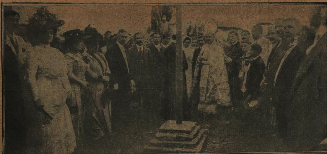
El obispo de Córdoba, fray Zenón Bustos, en el acto de la ceremonia religiosa de la colocación de la primera piedra del templo de Capilla del Monte