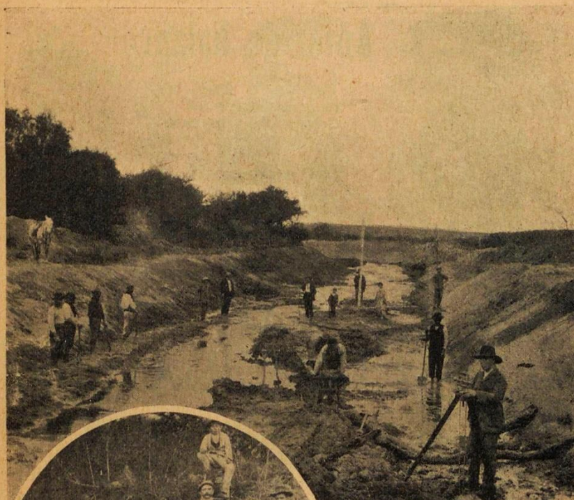
La irrigación en Córdoba